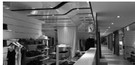
L'interno del Luxury Mall di Olbia