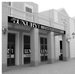
Il Luxury Mall di Agira